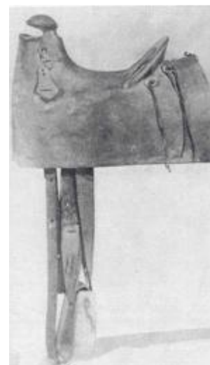
Mother Hubbard Saddle